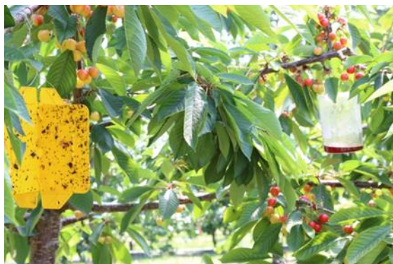
Überwachung mit Gelbtafel (Kirschenfliege) und Agroscope Becherfalle (KEF)