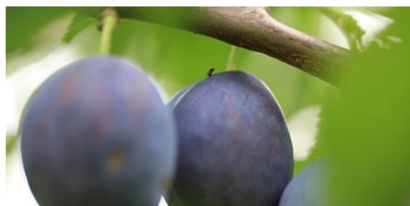
Fliegen sind tagsüber gerne im Schatten

7. Chemische Bekämpfung: Einsatz nur bei nachweislichem Auftreten der KEF in Parzelle oder in der Nähe. Zugelassen sind ausschliesslich die Mittel, welche in der Allgemeinverfügung über die Bewilligung eines Pflanzenschutzmittels in besonderen Fällen für Steinobst gelistet sind. Die Auflagen sind zwingend einzuhalten. Hinweis: Die KEF Strategie ist in Kirschen optimal mit der Kirschenfliegenbekämpfung abzustimmen (Nebenwirkung auf KEF). Bei Fängen in Überwachungsfallen oder bei Fruchtschäden: gezielte Behandlungen gegen KEF kulturspezifisch einplanen.