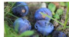
Tropfende Früchte und Fallobst als Brutstätten für KEF