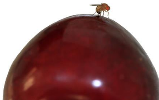
Weibchen bei Eiablage

3. Befallskontrolle: Ab Reifebeginn regelmässige Befallskontrollen von mind. 50 Früchten pro Schlag. Sie stellen sicher, dass Befall frühzeitig erkannt wird und Hygienemassnahmen intensiviert oder Erntetermin vorgezogen werden kann. Befallsproben auf Eiablagen und Einstichlöcher kontrollieren und/oder 2h in lauwarmes Salzwasser geben und danach auf Maden kontrollieren.