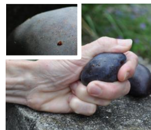
Eiablagen und Saftaustritt bei leichtem Druck