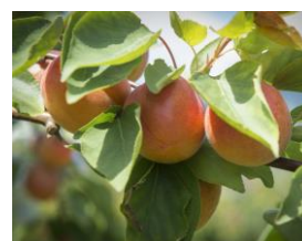
Aprikose und Pfirsich werden auch befallen