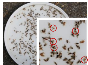
Einfache Bestimmung von ♂