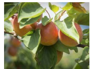
Aprikose und Pfirsich werden auch befallen