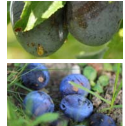
Tropfende Früchte und Fallobst als Brutstätten für KEF