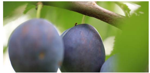
Fliegen sind tagsüber gerne im Schatten

7. Chemische Bekämpfung: Einsatz nur bei nachweislichem Auftreten der KEF in Parzelle oder in der Nähe. Zugelassen sind ausschliesslich die Mittel, welche in der Allgemeinverfügung über die Bewilligung eines Pflanzenschutzmittels in besonderen Fällen für Steinobst gelistet sind. Die Auflagen sind zwingend einzuhalten. Hinweis: Die KEF Strategie ist in Kirschen optimal mit der Kirschenfliegenbekämpfung abzustimmen (Nebenwirkung auf KEF). Bei Fängen in Überwachungsfallen oder bei Fruchtschäden: gezielte Behandlungen gegen KEF kulturspezifisch einplanen.