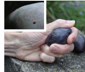
Eiablagen und Saftaustritt bei leichtem Druck