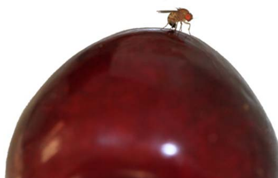
Weibchen bei Eiablage

3. Befallskontrolle: Ab Reifebeginn regelmässige Befallskontrollen von mind. 50 Früchten pro Schlag. Sie stellen sicher, dass Befall frühzeitig erkannt wird und Hygienemassnahmen intensiviert oder Erntetermin vorgezogen werden kann. Befallsproben auf Eiablagen und Einstichlöcher kontrollieren und/oder 2h in lauwarmes Salzwasser geben und danach auf Maden kontrollieren.