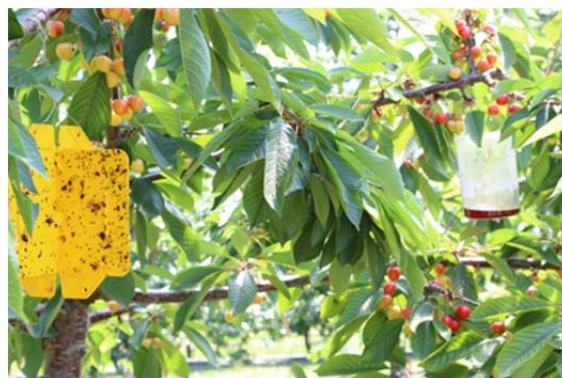
Überwachung mit Gelbtafel (Kirschenfliege) und Agroscope Becherfalle (KEF)