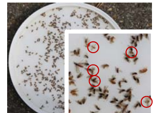
Einfache Bestimmung von ♂